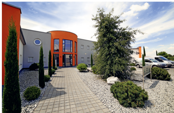
Der Unternehmenssitz in Dettenheim, Deutschland

Unternehmen unterschiedlicher Branchen verlassen sich heute auf die Kompetenz und den Service von Schreiber. Auf der Referenzliste des Unternehmens stehen Namen aus der Chemie und Petrochemie, dem Rohrleitungsbau, dem Maschinen- und Anlagenbau