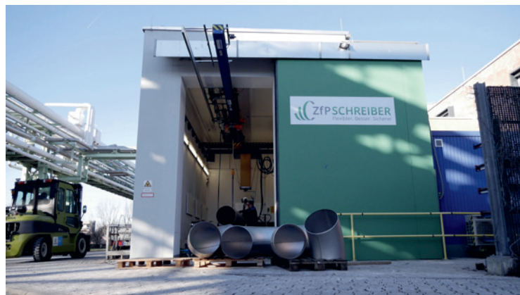
Zum Kundenkreis von Schreiber zählen auch Unternehmen aus dem Rohrleitungsbau

und von Kraftwerken. Hauptsächlich aus dem Mittelstand, kommen die Kunden aktuell überwiegend aus Deutschland. Aber die Prüfexperten sind auch immer häufiger für Kunden aus den Niederlanden und Belgien tätig.